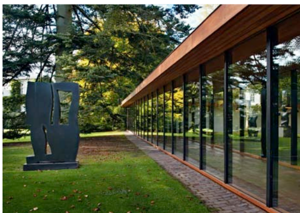
Lousiana med skulpturpark